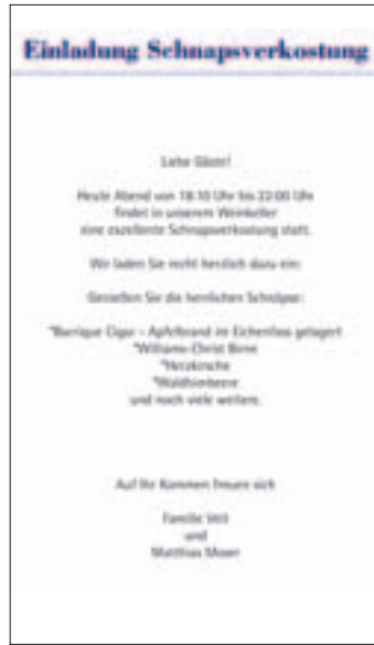
Beispiel Hotel Enzian.

Refinanzierungsmöglichkeit durch Werbeeinschaltungen.